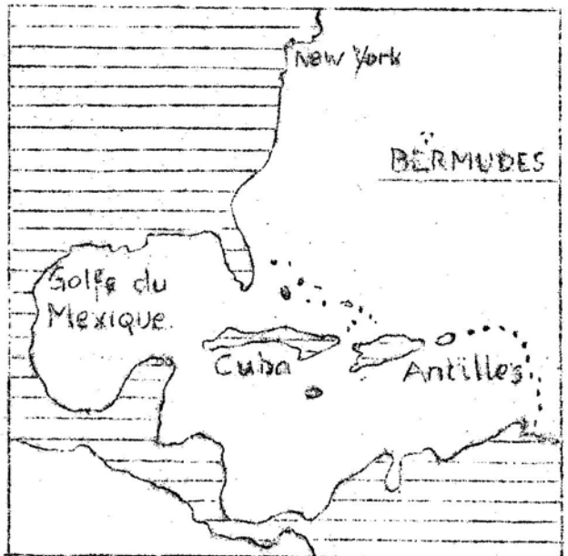
CARTOGRAPHIE du CFD 53